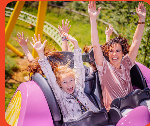
Ledendagen bij Attractiepark Toverland