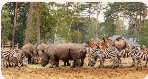
Ledendagen Beekse Bergen