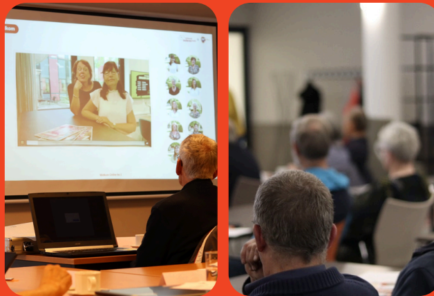
(Online) lezingen in samenwerking met Raadzaam Advies