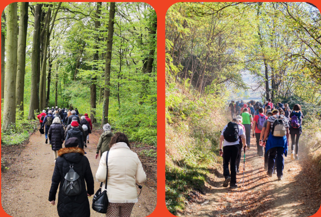
Voorjaarswandeling in samenwerking met Univé