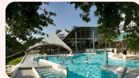
Ledenweken Thermae 2000